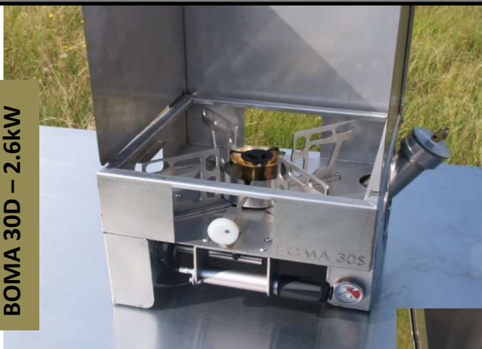
BOMA 30D – 2.6kW